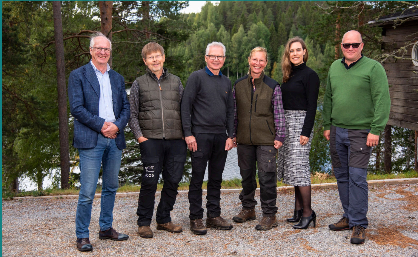
Grundarna i Granö 2020